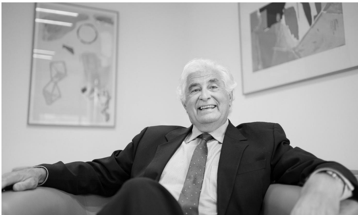
JOSÉ LUIS CURBELO, PRESIDENTE DE COFIDES.

“El Fondo de Recapitalización de empresas afectadas por la COVID-19 (FONREC) ha culminado su periodo de inversión con la aprobación de 779 millones de euros a 89 empresas con 37.000 empleos directos”.