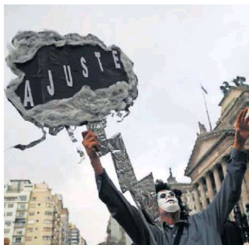
Un enmascarado protesta frente al Congreso argentino contra la intervención del FMI.

nentes, las indicaciones geográficas, el transporte marítimo y los productos lácteos y cárnicos", precisa.