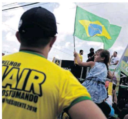
Partidarios del candidato a la presidencia de Brasil Jair Bolsonaro, durante una manifestación en Manaus.