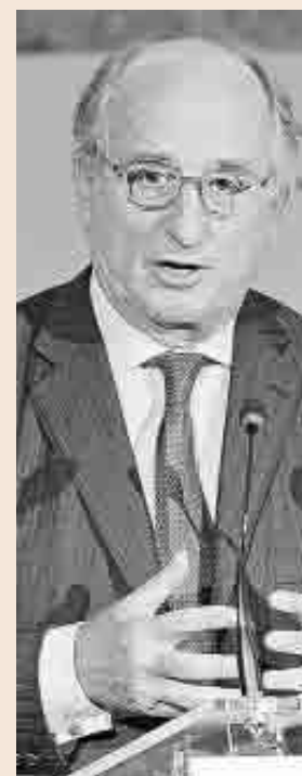
Antonio Brufau, presidente de Repsol, en su intervención.

El presidente de Repsol, Antonio Brufau, que también participó en la Cumbre, advirtió a la economía española de que si los empresarios no atraen y retienen el talento, la situación de "ventaja competitiva" que tiene España en Europa "puede desaparecer". "Si no continuamos invirtiendo en talento, si no generamos, atraemos y retenemos este talento, esta situación de ventaja competitiva que tenemos y que está haciendo que España esté liderando el crecimiento de Europa puede desaparecer, porque los demás están corriendo mucho", alertó el presidente de la petrolera. No obstante, admitió que las compañías españolas están realizando un "magnífico trabajo" y generando un modelo de crecimiento "más sensato", "basado en la productividad". Según explicó, este crecimiento tiene una razón de ser, que es "el talento de la gente", que "innova, explora, investiga, invierte y exporta". Según el presidente de Repsol, para que una empresa se convierta en global debe abrirse al exterior, aceptar la diversidad y entender las necesidades de la sociedad en la que está operando. En este sentido, Brufau señaló que "lo mejor" de la compra de la petrolera canadiense Talisman Energy es que supuso "una mezcla de los ADN anglosajón y español".