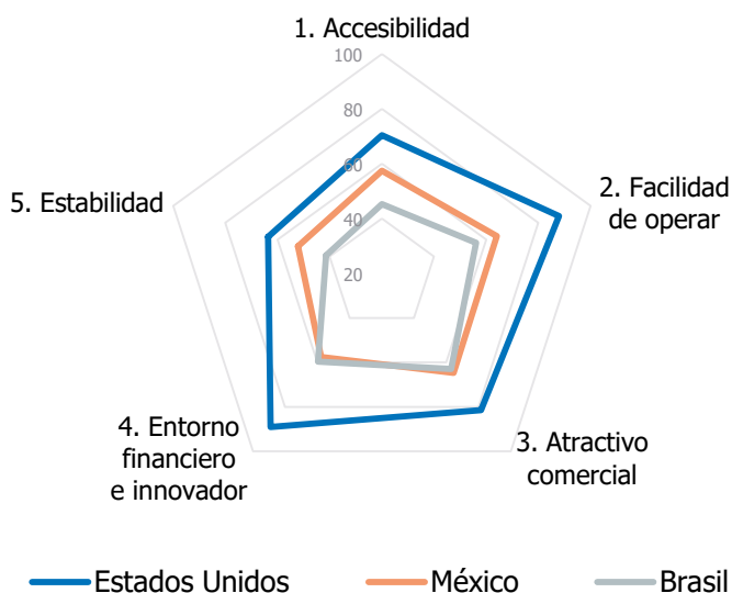
Gráfico 2. ICIE 2019: comparativa americana. Mín. 0 – Máx. 100. Fuente: CaixaBank Research

Por último, y dada la elevada heterogeneidad existente en algunas regiones, es importante para las empresas españolas analizar qué países de una misma región pueden ser más atractivos para internacionalizarse y por qué, para lo cual el ICIE también puede ser una herramienta de utilidad. Como vemos a continuación, América es un buen ejemplo de esta diversidad (véase el gráfico 2).